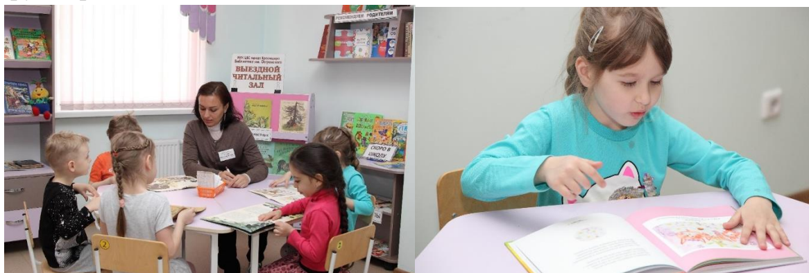
Рассматривание книг с рассказами о животных, прогнозирование содержания.

Дети рассматривают книгу, иллюстрации к ней, прогнозируют содержание. Прогнозирование содержания – важный вид работы, который помогает ребёнку разобраться в фактическом, сюжетном содержании произведения, также формирует правильный тип читательской деятельности.