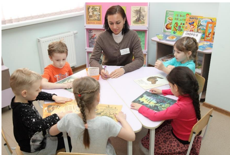
Рассматривание книг с рассказами о животных.