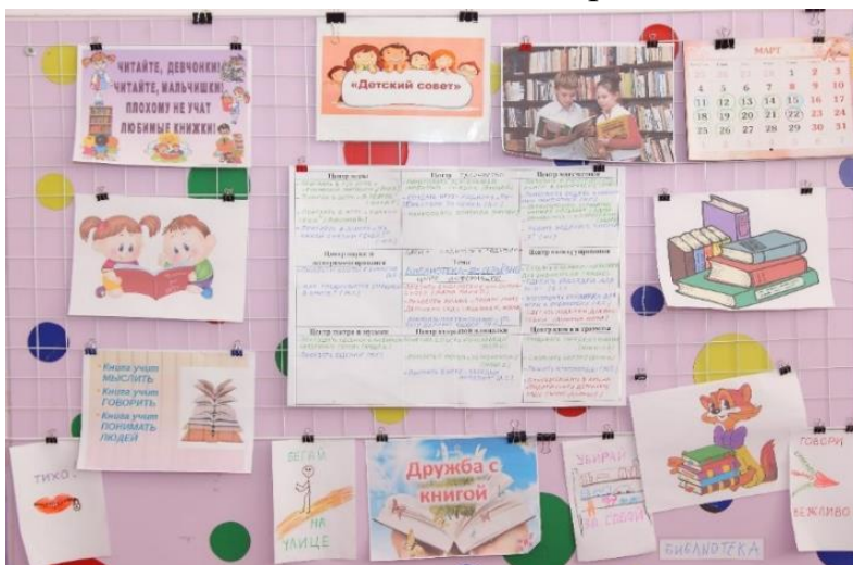
«Лотос – план» - совместный план работы над проектом всех участников образовательных отношений (детей, педагогов, родителей).

В рамках проведения социально-значимого проекта Стимулирование читательской активности семей воспитанников посредством взаимодействия МАДОУ МО г. Краснодар «Центр – детский сад № 201» и Библиотеки им. Н.А. Островского № 17 МУК ЦСБ города Краснодара в старших и подготовительных группах прошли проекты «Путешествие в мир книг», «Библиотека – это очень серьезно», «Наши любимые поэты и писатели» и др.